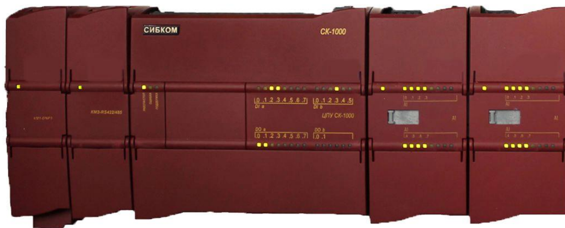
Рисунок 1 - Общий вид контроллеров

Внешний вид контроллеров и места нанесения знака поверки представлены на рисунках 1 и 2.