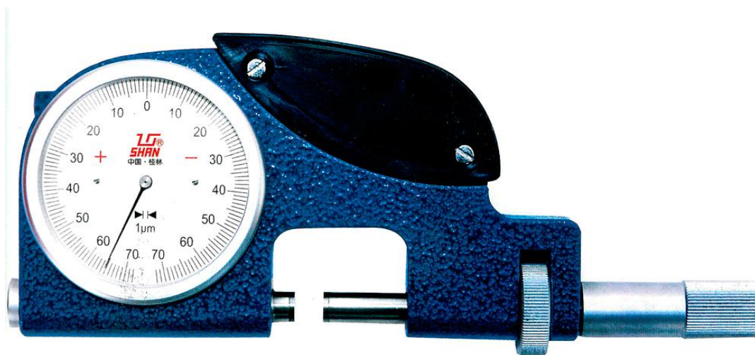
Рисунок 1 - Общий вид скоб с верхним пределом диапазона измерений до 100 мм

- Товарный знак «SHAN» наносится на паспорт скоб типографским методом, на циферблат отсчетного устройства и футляр скоб краской или методом лазерной маркировки.