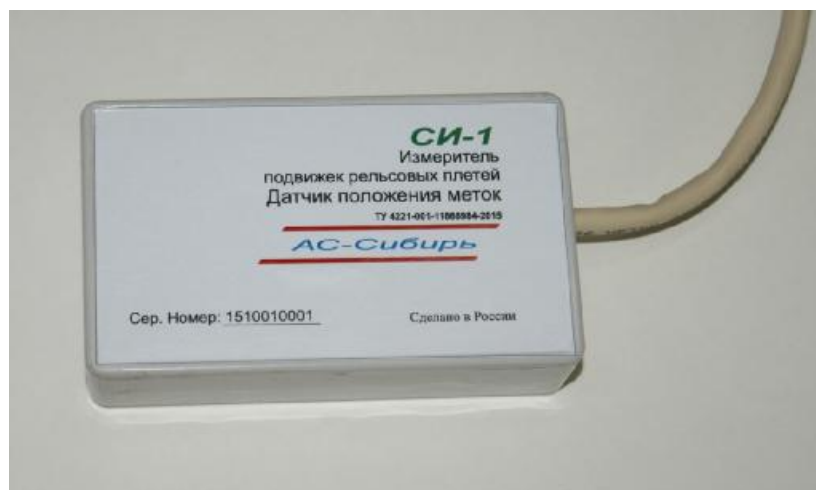
Рисунок 4 - Модуль датчика положения магнитных меток измерителя подвижек рельсовых плетей «СИ-1»