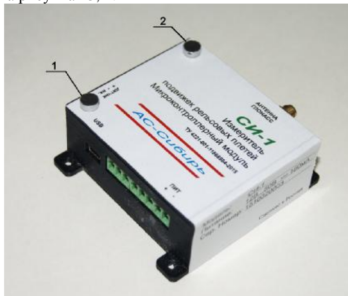
Рисунок 3 - Микроконтроллерный модуль измерителя подвижек рельсовых плетей «СИ-1» 1 - место установки пломбы изготовителя, 2 - место установки пломбы поверителя

Общий вид модулей и места пломбирования измерителя подвижек рельсовых плетей «СИ-1» представлены на рисунках 3, 4.