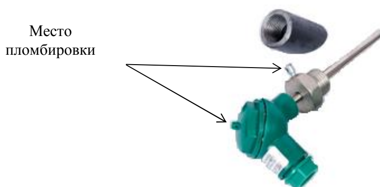
Рисунок 1 – Внешний вид термопреобразователя сопротивления ТСПА (исполнение PL)

Внешний вид термопреобразователей сопротивления ТСПА с указанием места пломбировки приведен на рисунках 1 и 2.