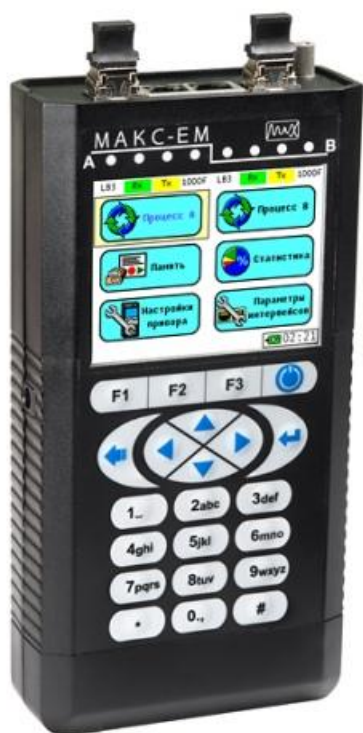
Рисунок 1- Общий вид тестера

Общий вид тестера и схема пломбировки от несанкционированного доступа (Н1 и Н2 пломбы, выполненные из однократно наклеиваемой ленты с уникальным изображением), представлены на рисунках 1 и 2 соответственно.