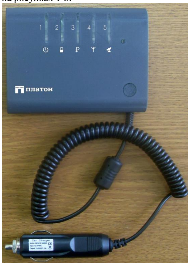
Рисунок 1 - Общий вид устройства

Внешний вид устройства с указанием мест нанесения знака утверждения типа и пломбирования приведен на рисунках 1-3.