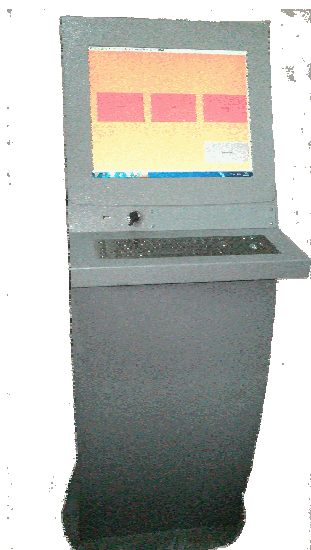
а) Управляющая ЭВМ (вид спереди)