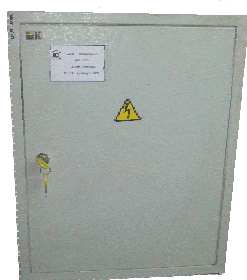
в) Шкаф автоматики (в закрытом состоянии)