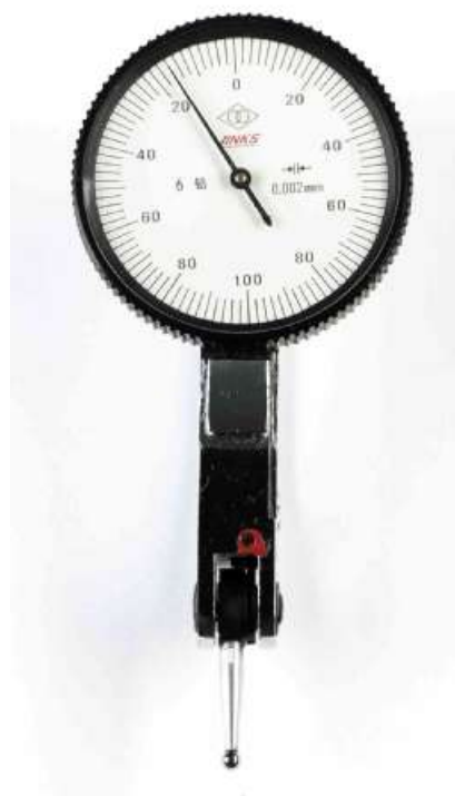
Рисунок 2 - Общий вид индикаторов серии 805