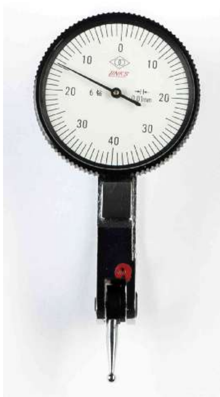
Рисунок 1 - Общий вид индикаторов серии 804