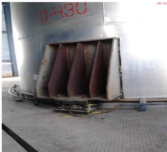
Рисунок 1 – Общий вид бункера D-430

Общий вид бункера D-430 показан на рисунке 1, а терминала IND 780 - на рисунке 2.