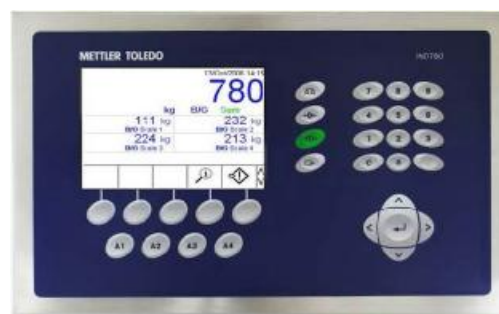
Рисунок 2 - Общий вид терминала IND780

На маркировочной табличке, закрепленной на терминале, должно быть указано: