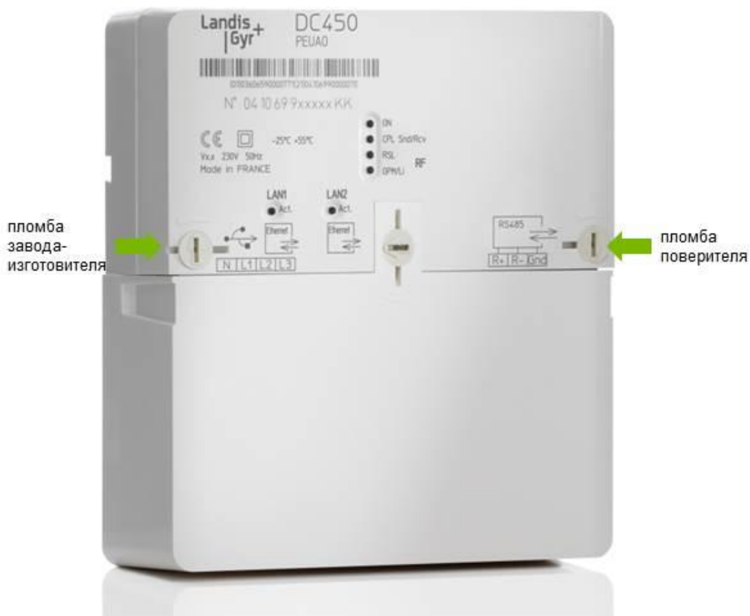
Рисунок 2 – Общий вид и места пломбирования DC450