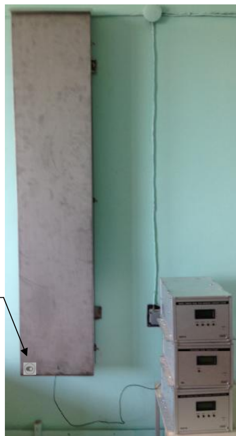
Рисунок 2 – Внешний вид ГВК