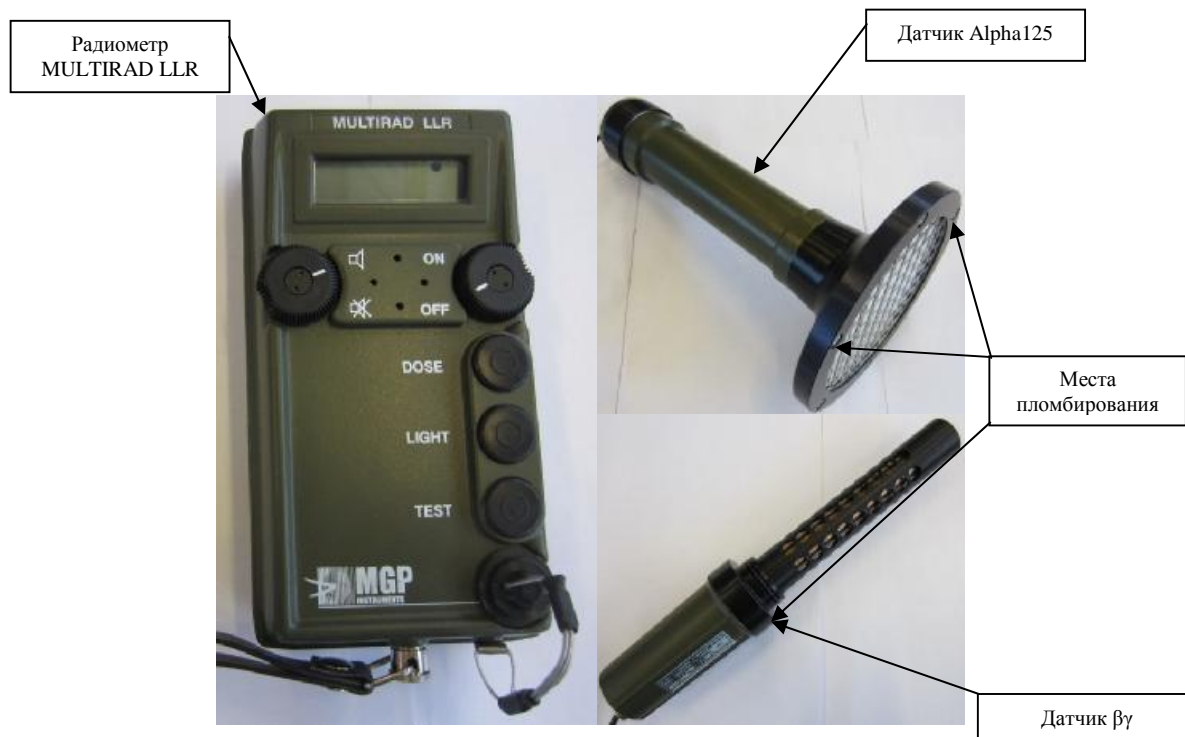
Рисунок 2 – Внешний вид подсистемы периодического и эпизодического радиационного контроля