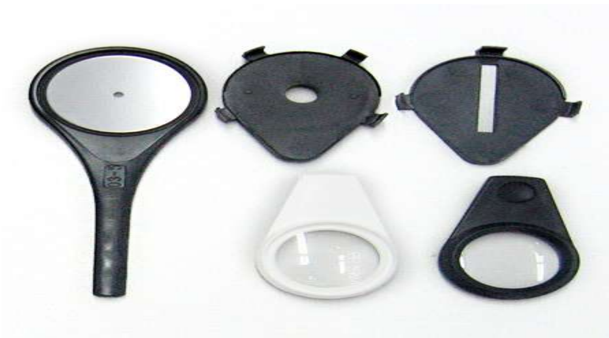
Рисунок 6 - Офтальмоскоп