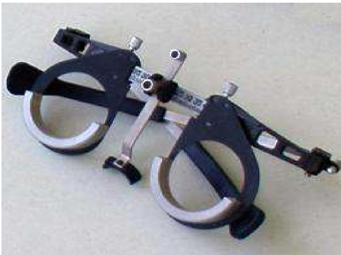
Рисунок 4 - Оправа пробная с четырьмя установочными местами для пробных очковых линз ОПОЛ-4-"СПб"