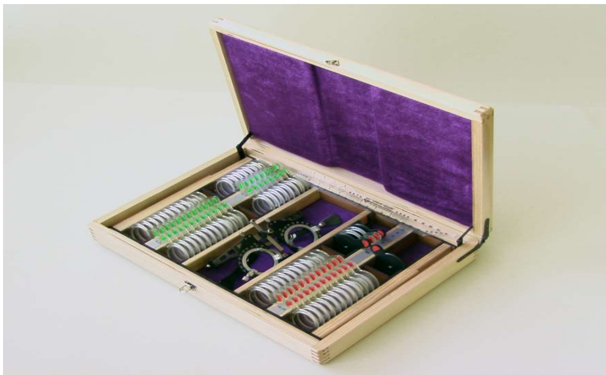
Рисунок 3 - Общий вид набора НПОЛу-87 в футляре и его основные составные части