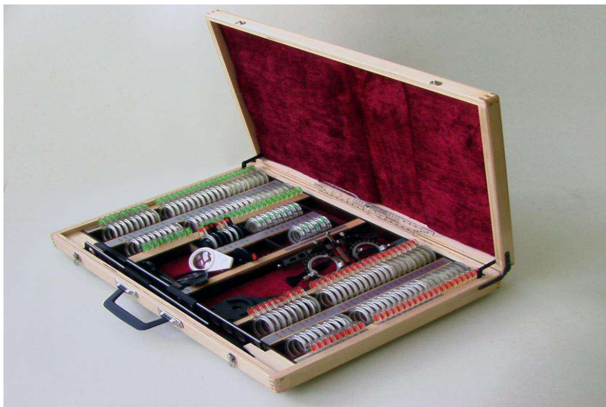
Рисунок 2 - Общий вид набора НПОЛс-139 в футляре и его основные составные части