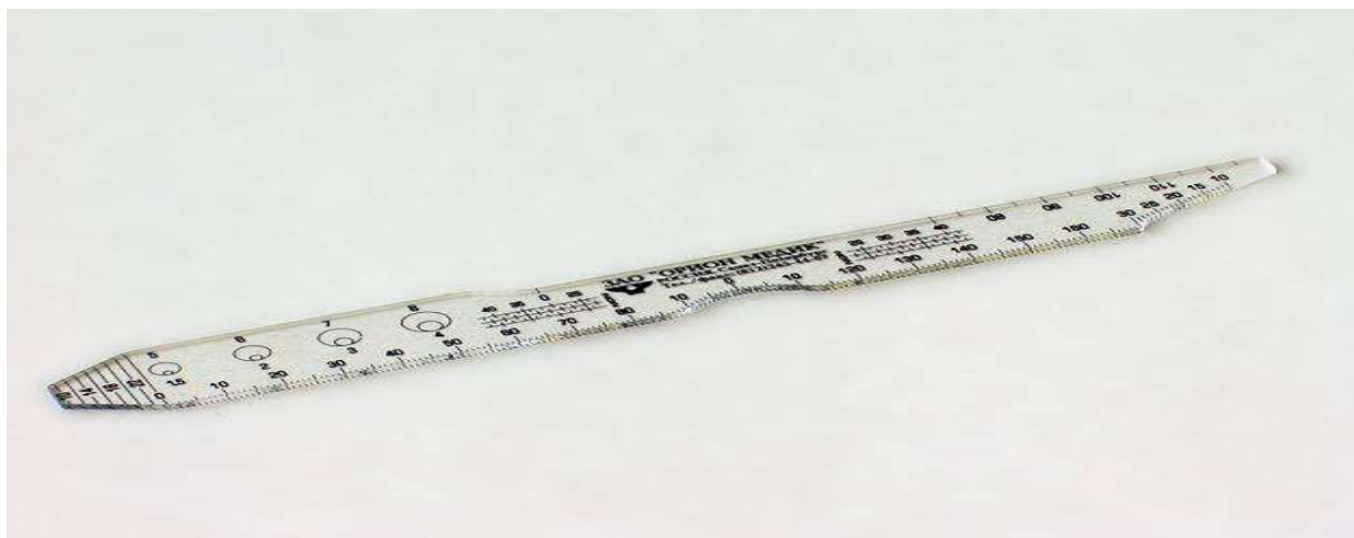
Рисунок 5 - Линейки для подбора очковых корригирующих оправ