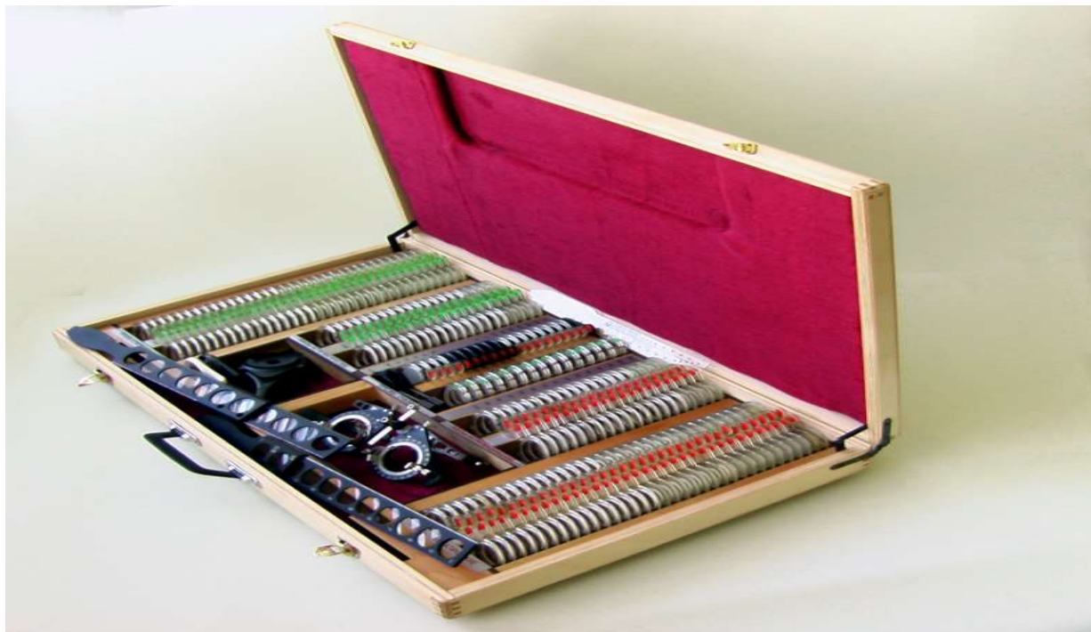
Рисунок 1 - Общий вид набора НПОЛб-254 в футляре и его основные составные части

Общий вид наборов в различных модификациях и их составные части представлены на рисунках 1 - 7.