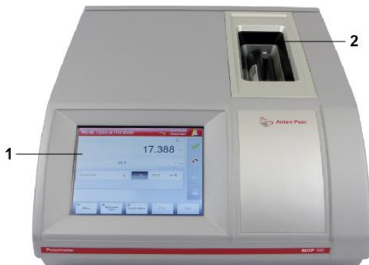
Рисунок 1 - Общий вид поляриметров автоматических цифровых MCP 100 (вид спереди): 1 - цветной сенсорный ЖК-дисплей; 2 - отделение измерительной ячейки