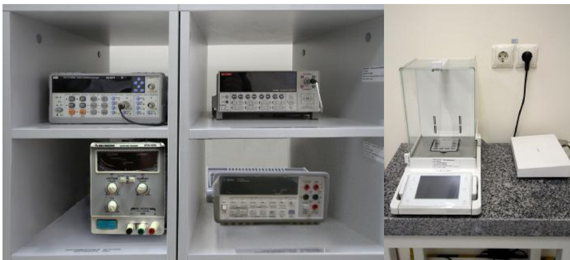
Рисунок 1 – Фото общего вида аппаратного комплекса калориметра

Общий вид калориметра БДСФ-01 представлен на рисунке 1 и рисунке 2.