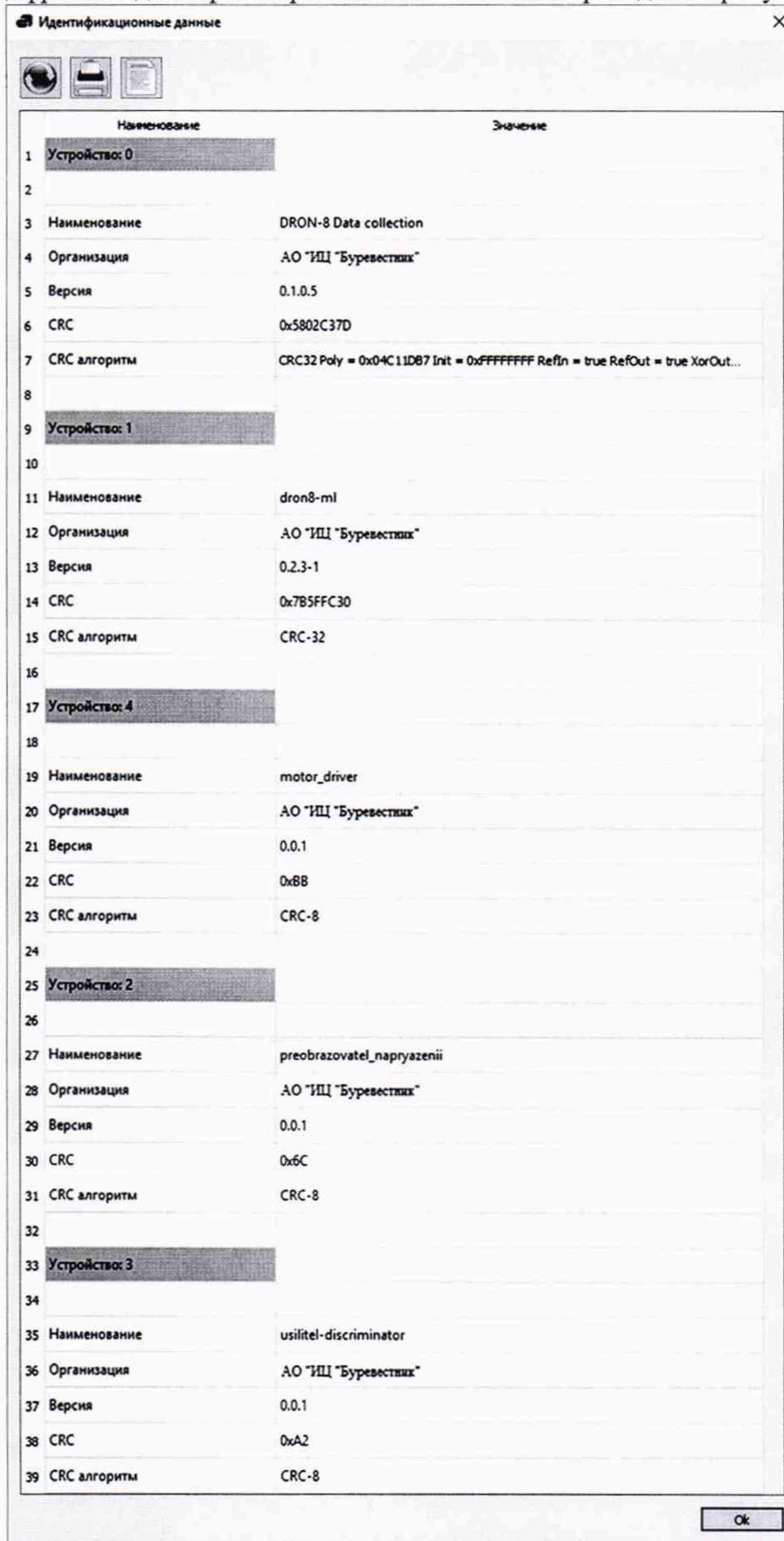
Рисунок 2. Окно с номерами версий и с цифровыми идентификаторами ПО Data Collection.

В главном меню окна ПО Data Collection открыть меню «Информация», в раскрывающемся списке выбрать подменю «Идентификационные данные». В открывшемся окне приведены наименования и номера версий ПО Data Collection, цифровые идентификаторы исполняемого файла DataCol.exe. Пример окна идентификации наименований ПО, номеров версий и цифровых идентификаторов ПО Data Collection приведен на рисунке 2.