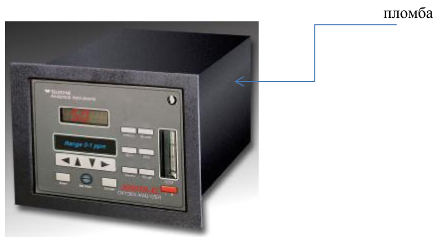
Рис. 1. Газоанализатор Teledyne 3000TA-XL – рабочий эталон 1-го разряда.

Элементы настройки измерительной части газоанализатора могут быть конструктивно защищены от несанкционированного проникновения опломбированием винтов, как показано на рисунке 2.