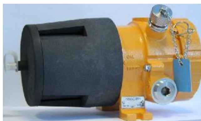
д) СГОЭС-М11 (исполнение в корпусе из алюминия)

Рисунок 3 - СГОЭС, СГОЭС-М, СГОЭС-М11 (СГОЭС-2, СГОЭС-М-2, СГОЭС-М11-2 имеют аналогичный внешний вид)