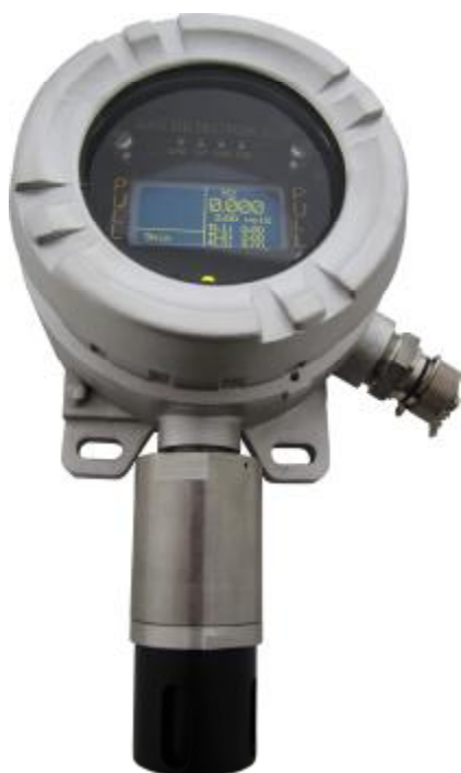
в) CCC-903МЕ (исполнение в корпусе из нержавеющей стали)