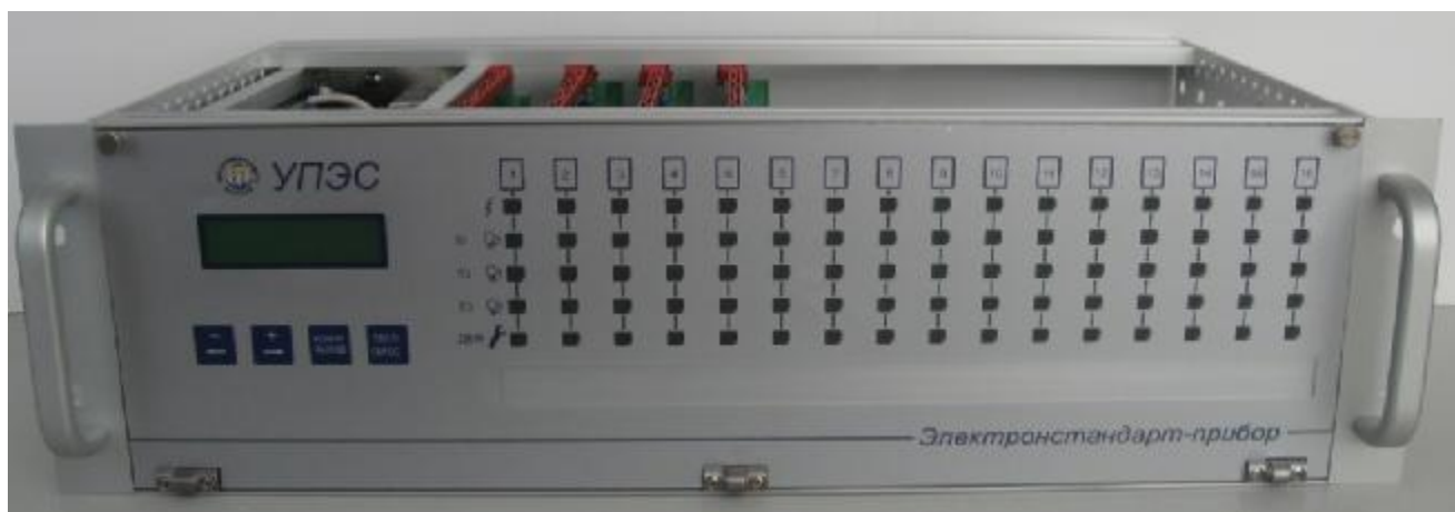
Рисунок 1 – Газоанализаторы многоканальные стационарные взрывозащищенные СГАЭС-ТГМ модификация СГАЭС-ТГМ14, панель управления УПЭС, внешний вид.

Внешний вид основных элементов СГАЭС-ТГМ14 приведен на рисунках 1 - 3.