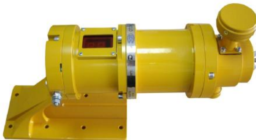
а) СГОЭС (с блоком отображения информации)