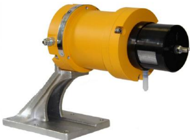
б) СГОЭС (без блока отображения информации)