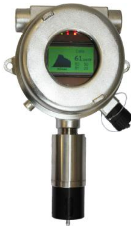
б) CCC-903М (исполнение в корпусе из нержавеющей стали)