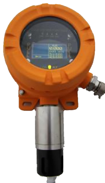
г) CCC-903МЕ (исполнение в корпусе из алюминиевого сплава)