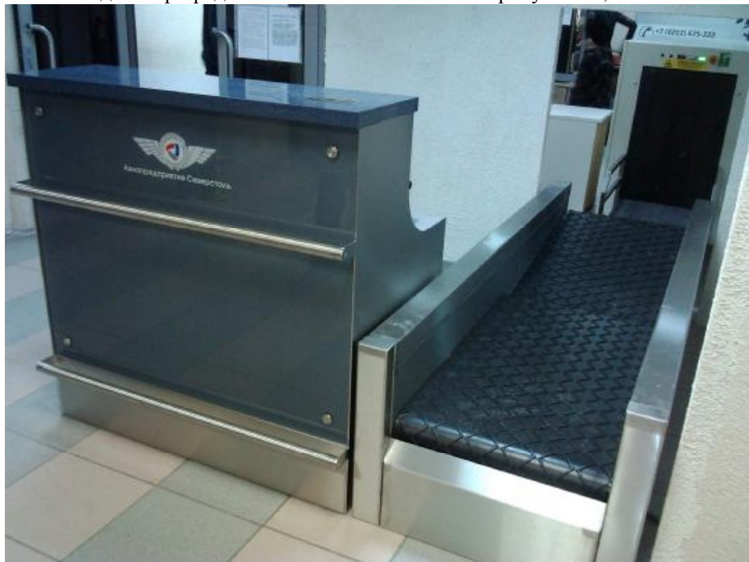
Рис. 1 Внешний вид весов PROCHECK.

Внешний вид весов PROCHECK, датчиков весоизмерительных тензорезисторных и применяемого индикатор представлены соответственно на рисунках 1, 2 и 3.