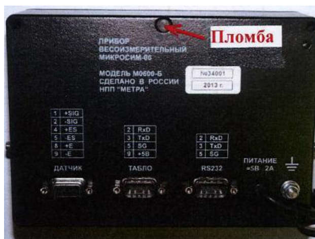
Рис. 4 Пломбировка прибора весоизмерительного.

ПО имеет уровень защиты от преднамеренных и непреднамеренных изменений в соответствии с Р 50.2.077-2014 «высокий». Для ограничения доступа к электронике прибора весоизмерительного на физическом уровне, предусмотрена пломбировка его корпуса как показано на рисунке 4.