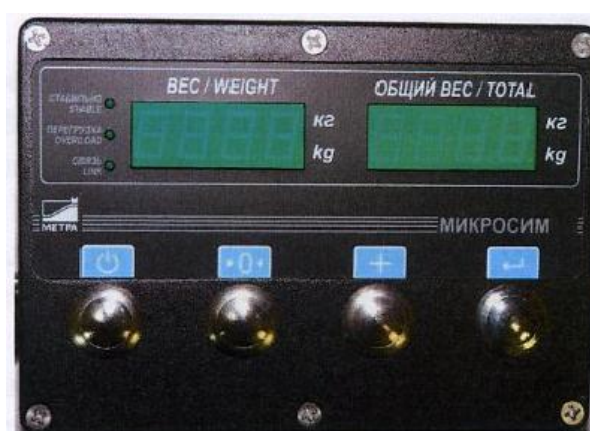
Рис. 3 Внешний вид прибора весоизмерительного

Маркировка весов выполнена в виде таблички, закрепленной на раме грузоприемного устройства и боковой стенке прибора Микросим, на которой нанесены следующие данные: