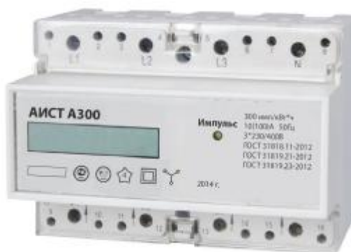
Рисунок 5. Вид электронного счетчика активной электрической энергии АИСТ А300 с креплением на DIN-рейку