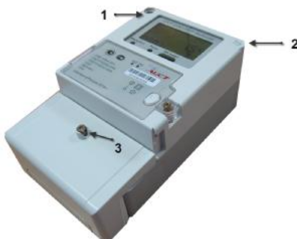
Рисунок 2. Фотография общего вида электронного счетчика активной электрической энергии АИСТ А100, где

Фотография общего вида однофазного электронного счетчика активной электрической энергии «АИСТ А100» представлена на рисунке 2.