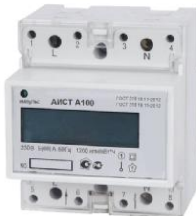
Рисунок 4. Вид электронного счетчика активной электрической энергии АИСТ А100 с креплением на DIN-рейку

Фотографии общего вида счетчиков «АИСТ А300» и «АИСТ 100» с вариантами крепления на DIN-рейку представлены на рисунках 4, 5.