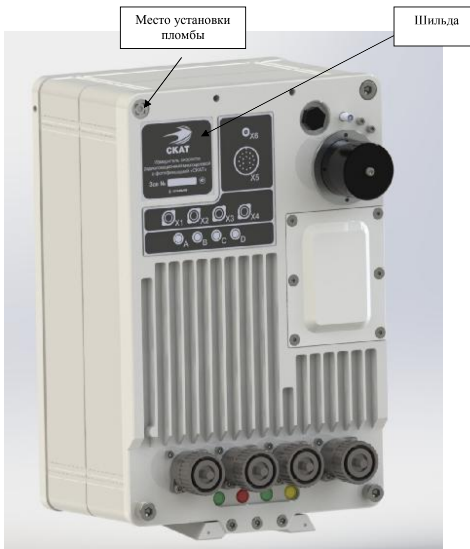
Рисунок 2 - Внешний вид и места установки шильды и пломбы на ИС.