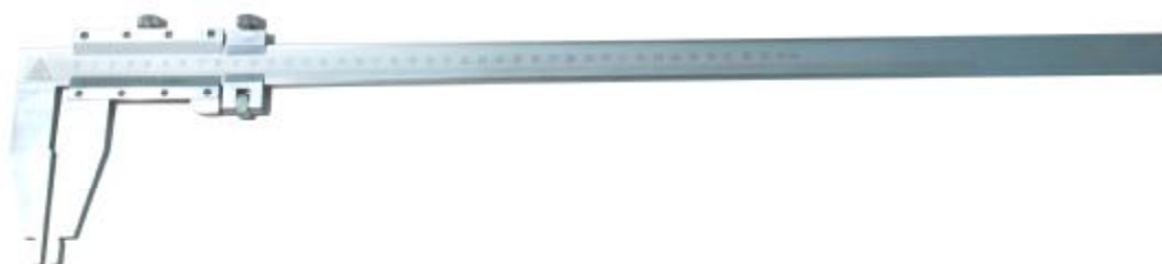
Рисунок 3 – Общий вид штангенциркулей типа ШЦ-III