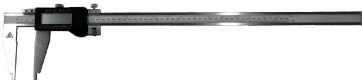
Рисунок 7 – Общий вид штангенциркулей типа ШЦЦ-III