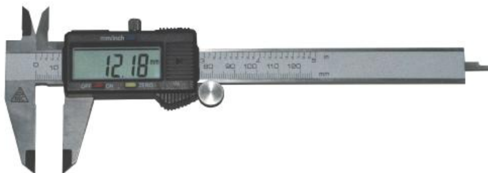
Рисунок 5 – Общий вид штангенциркулей типа ШЦЦ-I