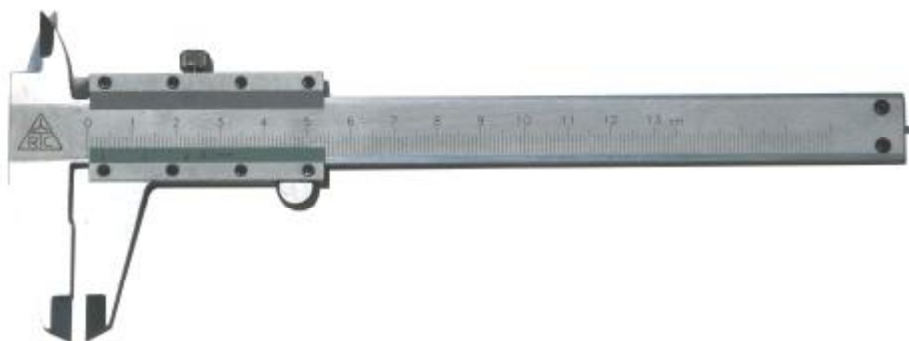
Рисунок 1 – Общий вид штангенциркулей типа ШЦ-I