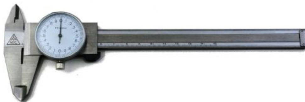
Рисунок 4 – Общий вид штангенциркулей типа ШЦК-I