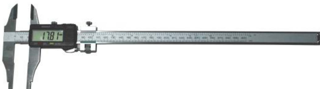
Рисунок 6 – Общий вид штангенциркулей типа ШЦЦ-II