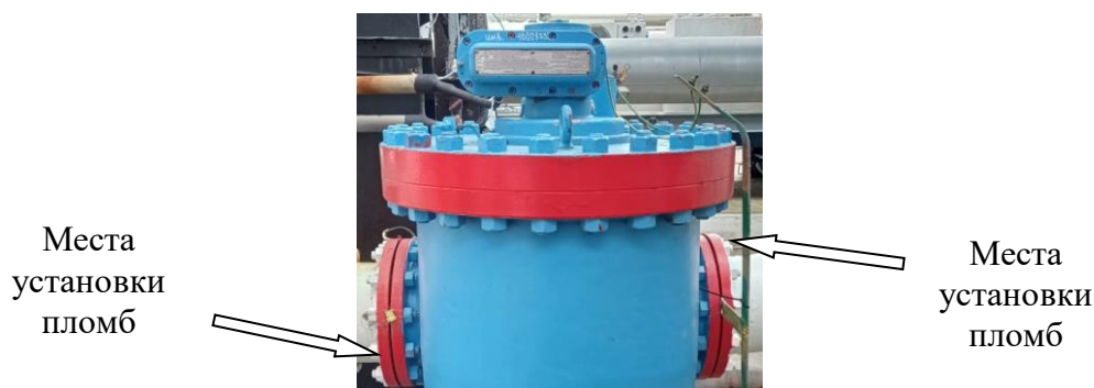
Рисунок 1 – Схема пломбировки от несанкционированного доступа ПР*

Схемы пломбировки от несанкционированного доступа с местами установки пломб представлены на рисунках 1-2.