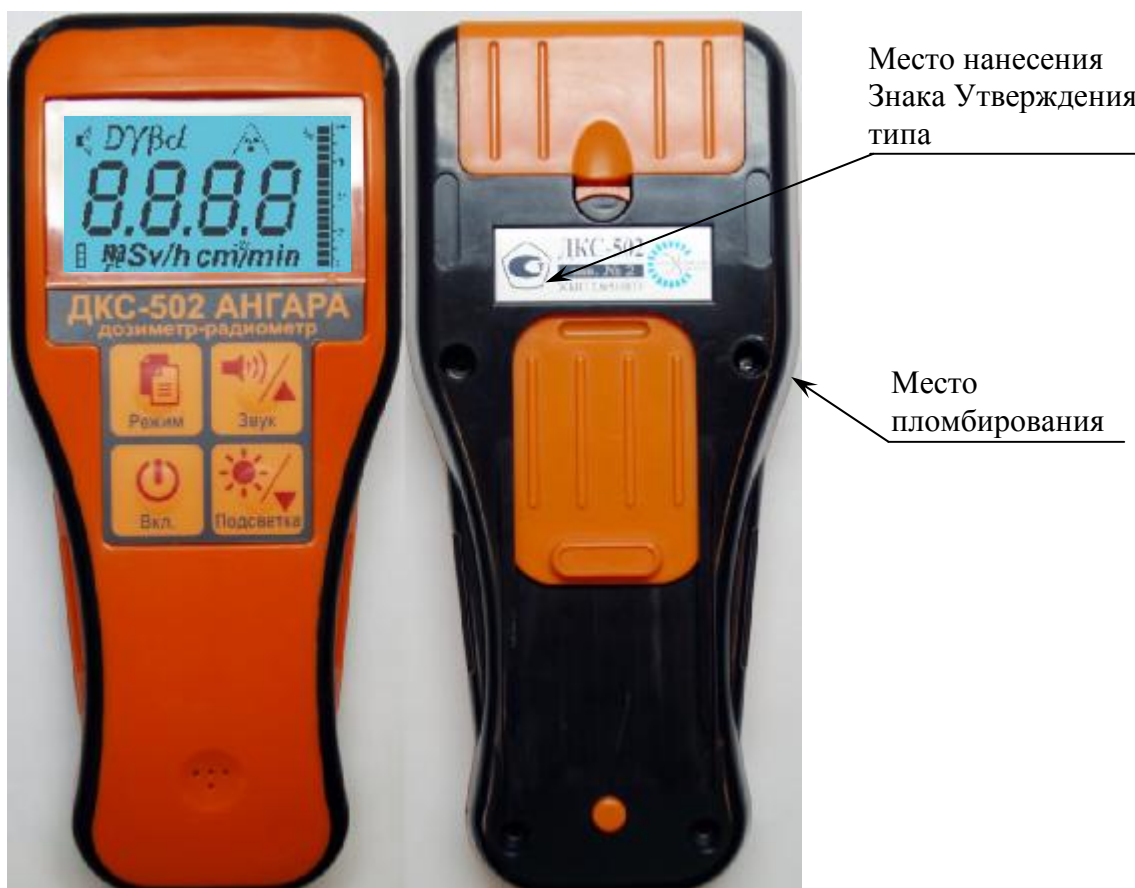
Рисунок 1 – Общий вид дозиметра-радиометра ДКС-502 «Ангара»