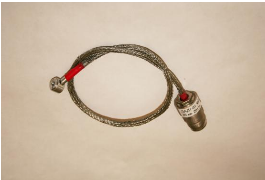
Рисунок 3 – Внешний вид детектора ДАД1-01

Внешний вид детектора ДАД1-01 приведен на рисунке 3.