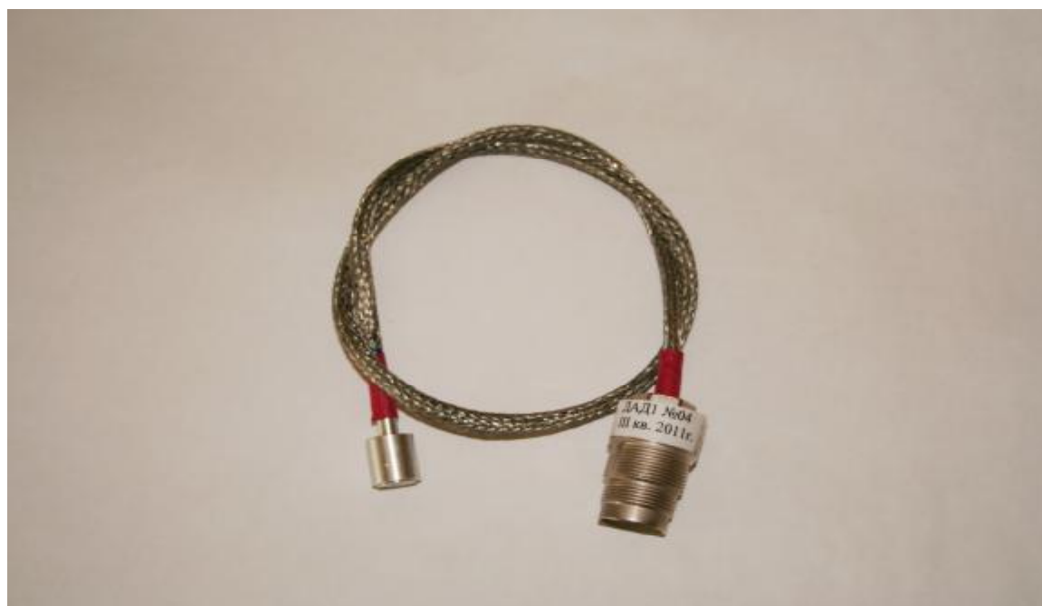
Рисунок 1 – Внешний вид детектора ДАД1

Внешний вид детектора ДАД1 приведен на рисунке 1.