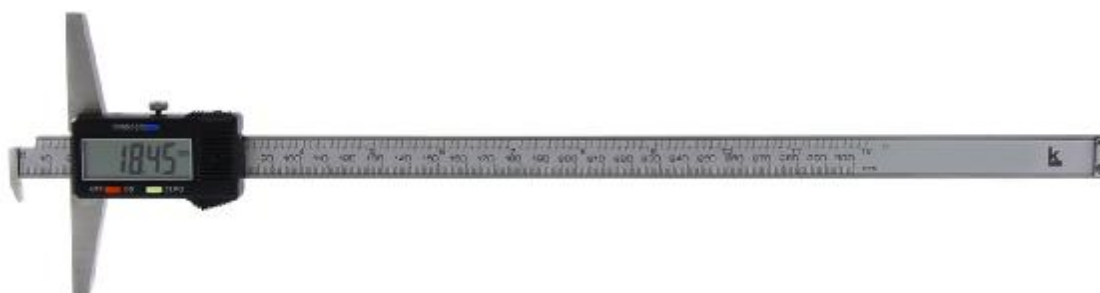
Рисунок 4 – Общий вид штангенглубиномеров торговой марки «Калиброн» с отсчетом по цифровому отсчетному устройству с Г-образной губкой