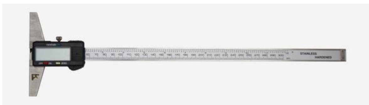
Рисунок 3 – Общий вид штангенглубиномеров торговой марки «Калиброн» с отсчетом по цифровому отсчетному устройству