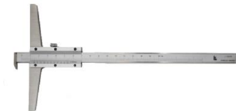
Рисунок 2 – Общий вид штангенглубиномеров торговой марки «Калиброн» с отсчетом по нониусу с Г-образной губкой