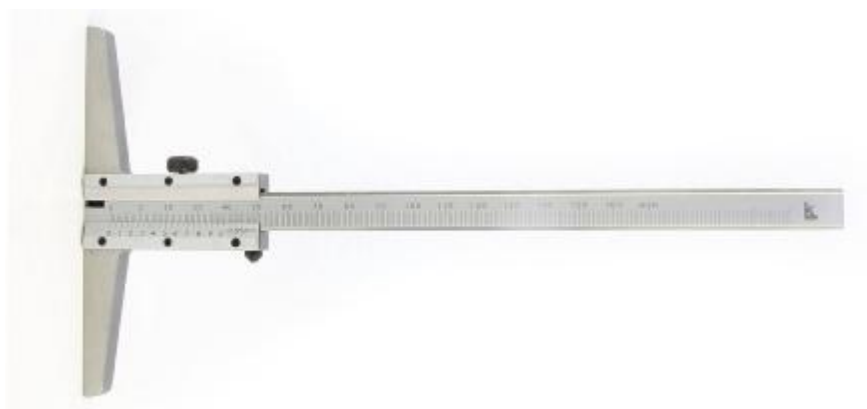
Рисунок 1 – Общий вид штангенглубиномеров торговой марки «Калиброн» с отсчетом по нониусу