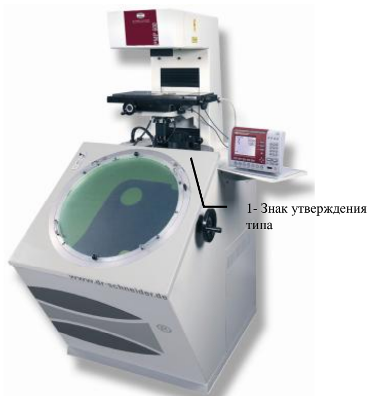
Рис 2. Фотография внешнего вида модель RMP 600

- Модель ST ( модификации: 600/ 600V/750/750V/1000/1000V)