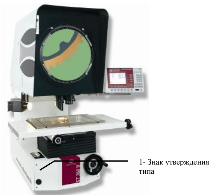
Рис 2. Фотография внешнего вида модель ST 360V

Дополнительная комплектация: сменные объективы 5х, 20х, 25х, 50х, 100х, ЧПУ управление перемещением измерительного стола, ПК, программное обеспечение SAPHIR;