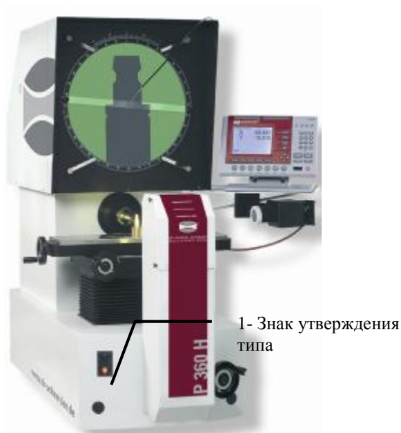
Рис 1. Фотография внешнего вида модель Р