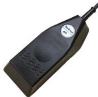
Рисунок 6 – Общий вид погружного датчика Доплера ДП