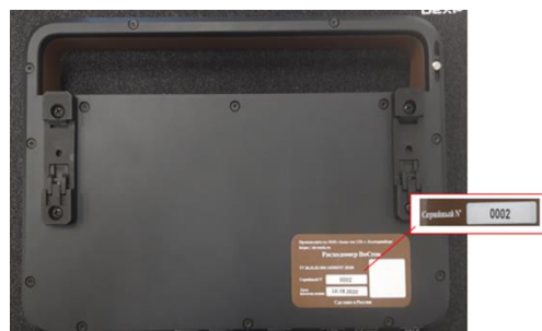
Рисунок 8 - Стационарный электронный вычислительный блок серийный № 0002