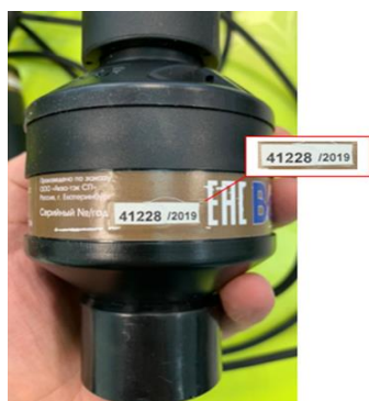
Рисунок 9 – Ультразвуковой датчик уровня ДУ-3 серийный № 41228