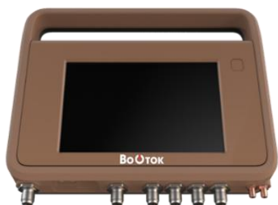
Рисунок 1 – Общий вид стационарного электронного вычислительного блока

Общий вид ЭВБ и датчиков показан на рисунках 1-7.