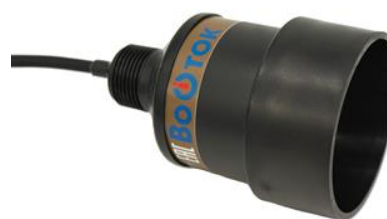
Рисунок 4 – Общий вид бесконтактного радарного датчика скорости ДС-6