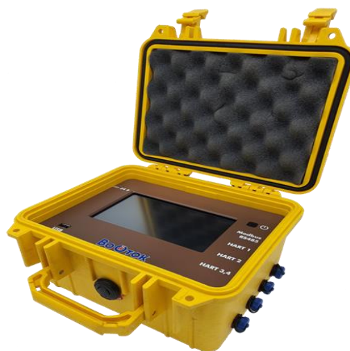
Рисунок 2 – Общий вид переносного электронного вычислительного блока