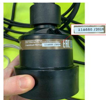
Рисунок 10 - Радарный датчик скорости ДС-6 серийный № 116888