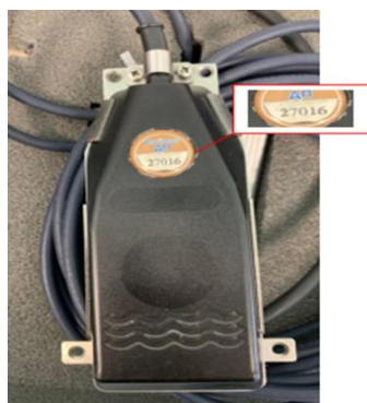
Рисунок 11 - Погружной датчик Доплера ДП с компенсатором барометрического давления серийный № 27016