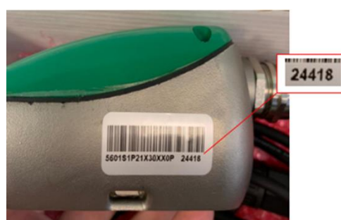
Рисунок 12 - Накладной датчик Доплера ДН серийный № 24418

Знак поверки наносится на свидетельство о поверке и/или в паспорт.