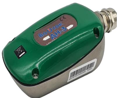
Рисунок 5 – Общий вид накладного датчика Доплера ДН