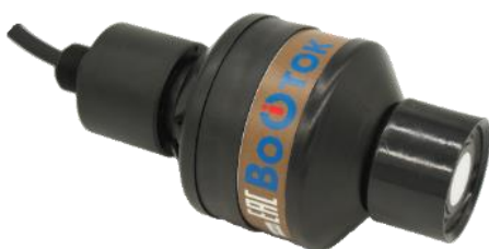
Рисунок 3 – Общий вид ультразвукового датчика уровня ДУ-3