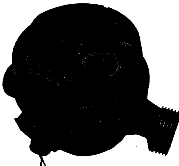
Рисунок 1 – Внешний вид счетчиков воды крыльчатых «СТРУМЕНЬ»

Внешний вид счетчиков воды представлен на рисунке 1. Места пломбирования счетчиков указаны в приложении А к описанию типа.