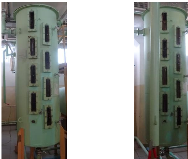
Рисунок 1 - Общий вид мерников К7-ВМА, зав.№№ 462, 463

Схема пломбировки от несанкционированного доступа, обозначение места нанесения знака поверки представлены на рисунке 2.