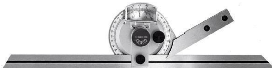
Рисунок 2 - Общий вид угломеров ВР-301