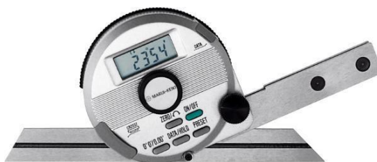
Рисунок 3 - Общий вид угломеров DP-601

Пломбирование угломеров не предусмотрено. Знак поверки наносится на свидетельство о поверке.