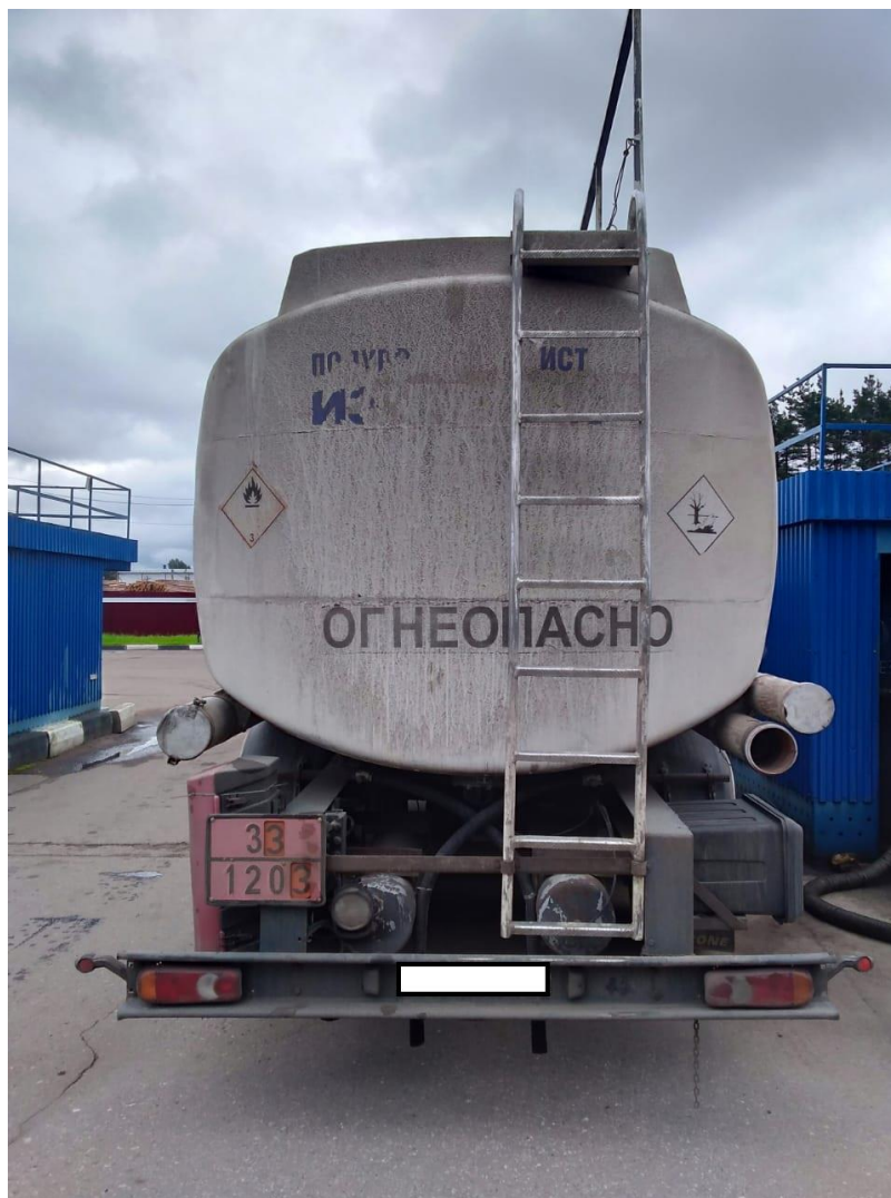
Рисунок 2 – Общий вид полуприцепа-цистерны DROMECH

Схема пломбировки для защиты от несанкционированного изменения положения уровня налива, обозначение места нанесения знака поверки представлены на рисунке 3.