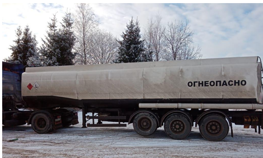
Рисунок 1 – Общий вид полуприцепа-цистерны DROMECH

Общий вид полуприцепа-цистерны DROMECH представлен на рисунках 1-2.