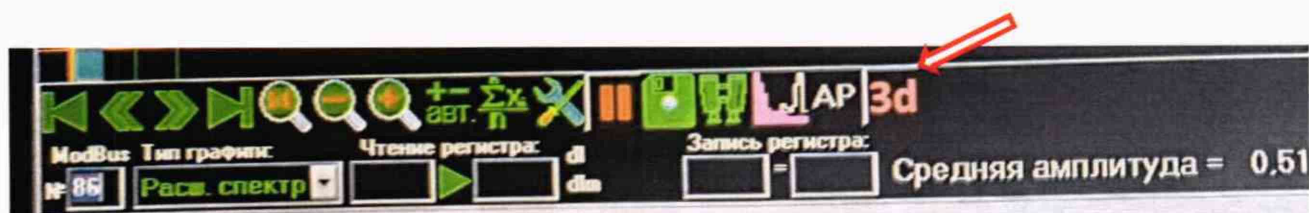
Рисунок 1 – Отключение 3D моделирования