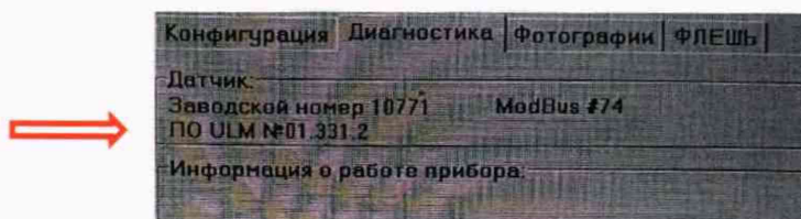
Рисунок 3 – Идентификация версии ПО