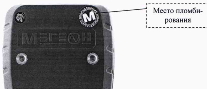
Рисунок 1 – Место пломбировки

Наличие сохранности пломбировки проверяют при периодической поверке. Место нанесения пломбировки указано на рисунке 1.