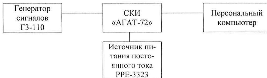
Рисунок 6.3.3 Схема подключения к АГАТ на диапазоне измерений от 200 Гц до 8000 Гц

Собрать схему подключения к первому каналу системы АГАТ в соответствии с рисунком 6.3.3.