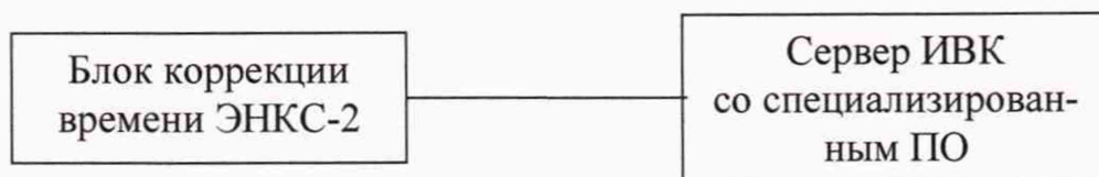
Рисунок 1 - Схема проверки ухода часов на сервере ИВК

Включают блок коррекции времени ЭНКС-2, принимающий сигналы глобальной навигационной спутниковой системы (ГЛОНАСС), подключают к ноутбуку, где настраивают специализированное ПО для применяемого эталонного устройства синхронизации времени, УСПД подключают к ноутбуку (Рисунок 2). В течение суток сверяют показания блока коррекции времени ЭНКС-2 с показаниями часов УСПД, получающего сигналы точного времени от встроенного приемника точного времени. Расхождение показаний блока коррекции времени с УСПД не должно превышать \pm 1 с. Для снятия синхронизированных измерений рекомендуется при возможности ПО зафиксировать показания обоих часов или сделать скриншот экрана, на котором выведены эталонные и проверяемые часы.