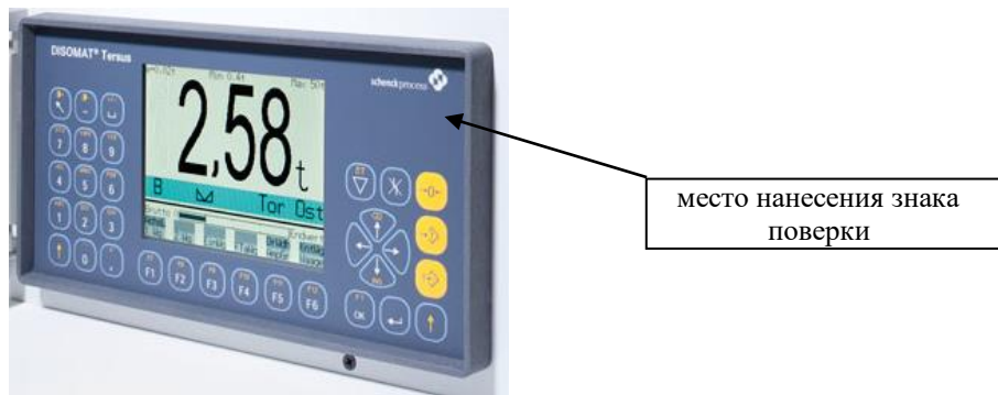
Рисунок 2 – Место нанесения знака поверки на прибор весоизмерительный DISOMAT Tersus

Знак поверки в виде наклейки наносится на корпус прибора весоизмерительного. Место нанесения знака поверки, а так же схема пломбировки корпуса интерфейсного разъема прибора весоизмерительного от несанкционированного доступа к функциям юстировки приведены на рисунках 2, 3.