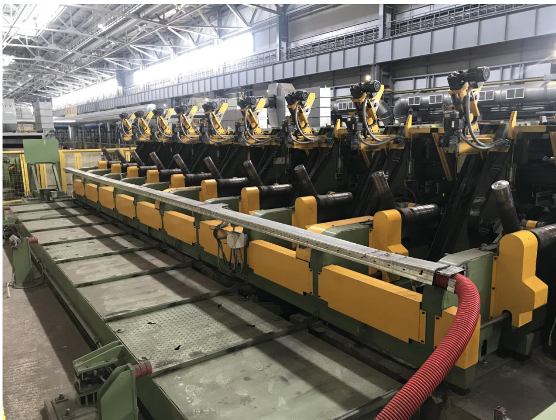
Рисунок 1 – Общий вид весов электронных Pocket Truck

Общий вид ГПУ весов представлен на рисунке 1.