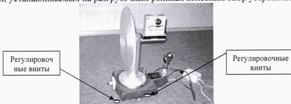
Рисунок 1 - Установка угломерная на основе столов поворотных СТ-9

7.4.1.1 Проверку диапазона измерений углов развала колес проводить с помощью квадранта оптического, путем последовательной попарной установки (соответственно на местах размещения передней и задней осей автомобиля) установок угломерных на основе столов поворотных СТ-9 (далее - установки угломерные). Установки угломерные (Рис. 1) размещаются на площадках, устанавливаемых на разгрузочных роликах колесных опор устройства.