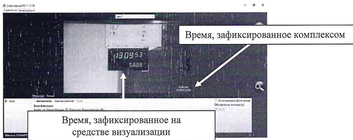
Рисунок 2 – Индицируемое время и время, наложенное на изображение комплексом

8.4.5 Определить абсолютную погрешность синхронизации времени относительно национальной шкалы времени UTC(SU) по формуле (1) (с учетом поясного времени):