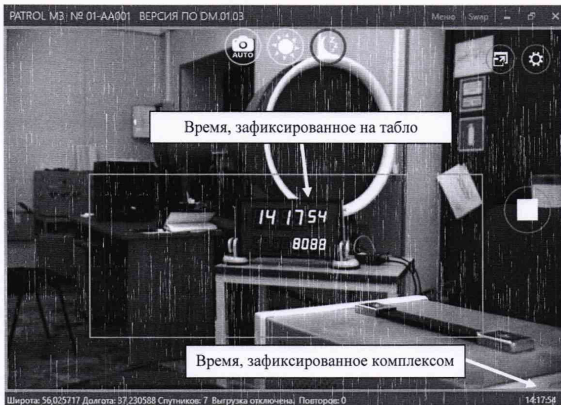
Рисунок 2 – Индицируемое время и время, наложенное на изображение комплексом

8.4.3 С помощью интерфейсной программы комплекса сделать не менее 10 фотографий средства визуализации, записать командой «PrintScreen» фото изображений: индицируемое время и время, наложенное на изображение комплексом в соответствии с рисунком 2.