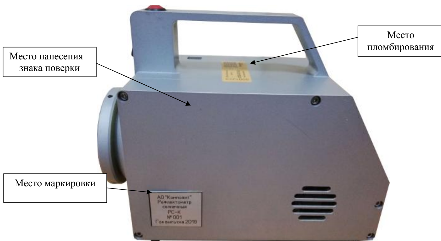
Рисунок 2 - Схема пломбировки от несанкционированного доступа, обозначение места нанесения знака поверки