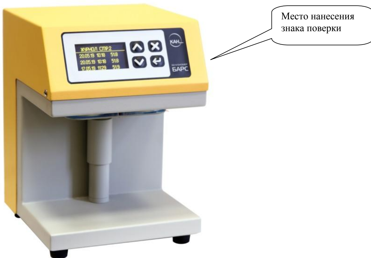
Рисунок 1 – Общий вид белизномера