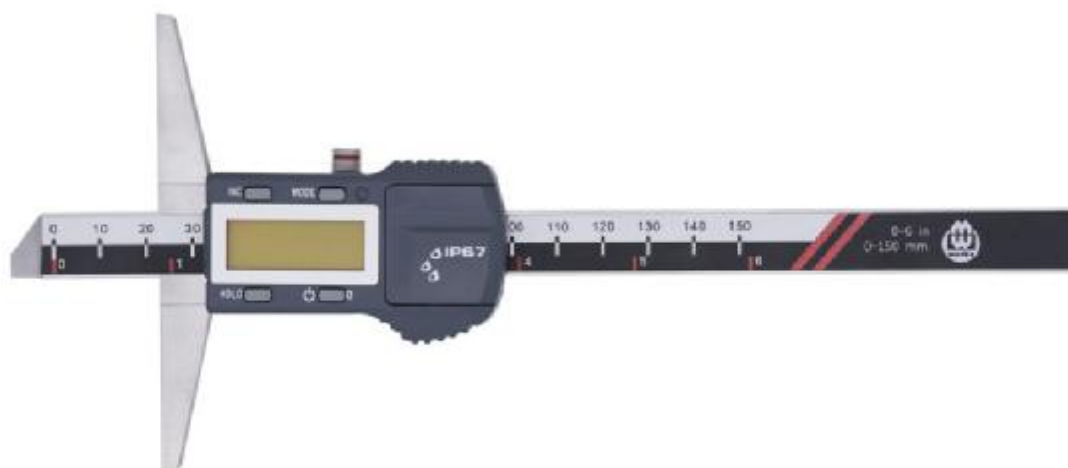
Рисунок 3 – Общий вид штангенглубиномеров с цифровым отсчетным устройством