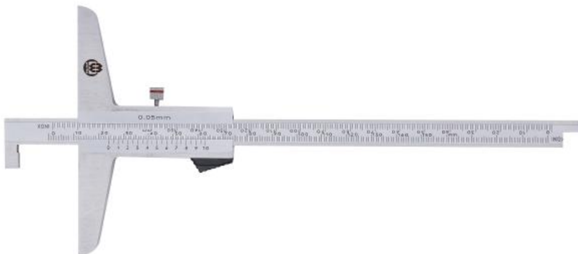
Рисунок 2 – Общий вид штангенглубиномеров с отсчетом по нониусу с Г-образной штангой