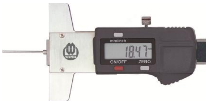
Рисунок 5 – Общий вид штангенглубиномеров с цифровым отсчетным устройством для измерений глубин в малых отверстиях