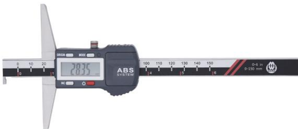
Рисунок 4 – Общий вид штангенглубиномеров с цифровым отсчетным устройством с Г-образной штангой