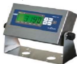
ТИТАН Н12, ТИТАН Н12К