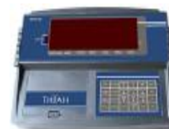
ТИТАН 3Ц, ТИТАН 3ЦС