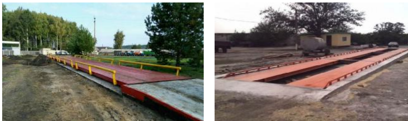
Рисунок 1 - Общий вид ГПУ весов (примеры)

Общий вид ГПУ весов представлен на рисунке 1.