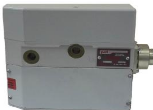
Рисунок 1 - Общий вид устройства измерения и формирования давления системы СУТП, модификации СУТП-Л, встроенного в регулятор локомотивного торможения, без крана машиниста локомотива (локомотивный полукомплект)