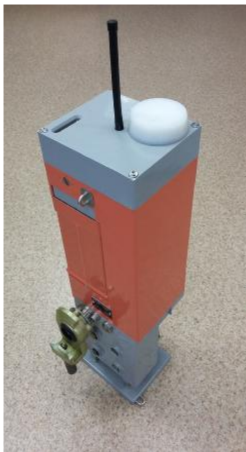
Рисунок 2 - Общий вид устройства измерения и формирования давления системы СУТП, модификации СУТП-В, встроенного в блок хвостового вагона (вагонный полукомплект)