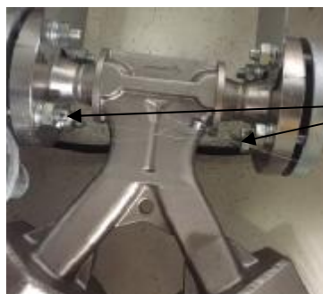
Место нанесения знака поверки