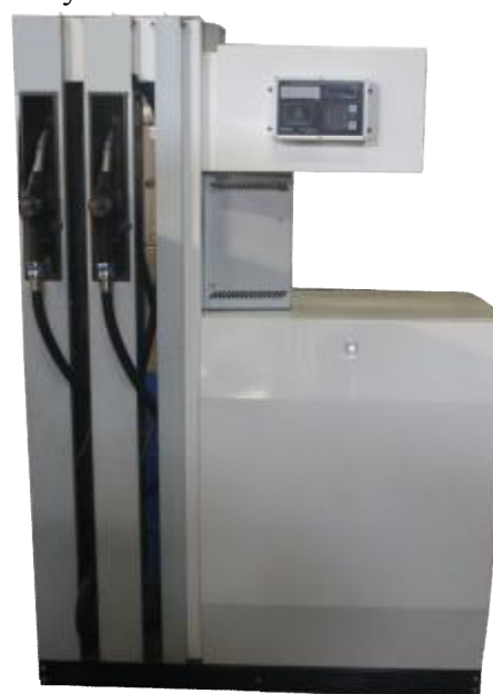
Рисунок 6 - УТ «Камка» 8211

Порядок обозначения Установки топливораздаточные "Камка" в документации и при заказе УТ Камка X_1X_2X_3X_4 - X_5X_6 / X_7 , где: