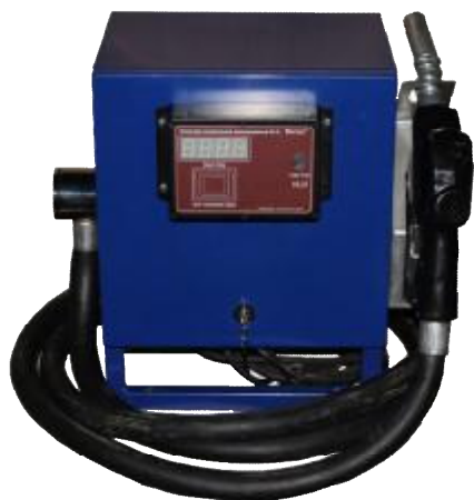
Рисунок 3 - УТ «Камка» 6100-21