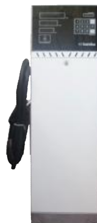
Рисунок 2 - УТ «Камка» 5111