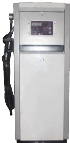
Рисунок 1 - УТ «Камка» 4110

Фотографии общего вида УТ представлены на рисунках 1-6.