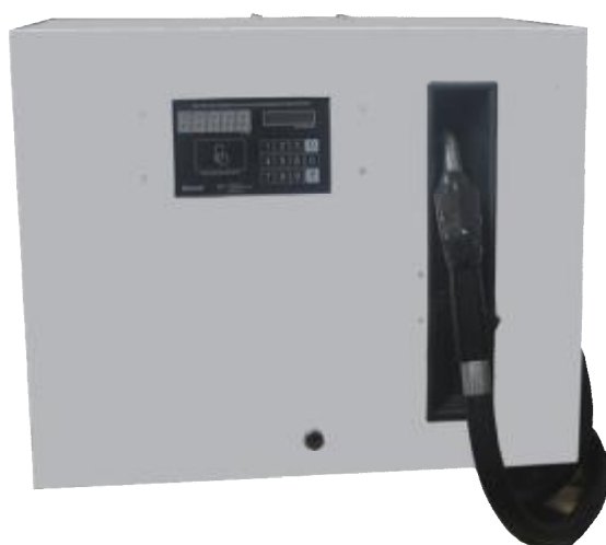
Рисунок 5 - УТ «Камка» 7111