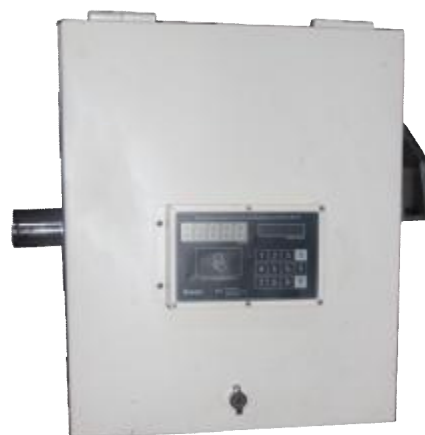
Рисунок 4 - УТ «Камка» 6100-22