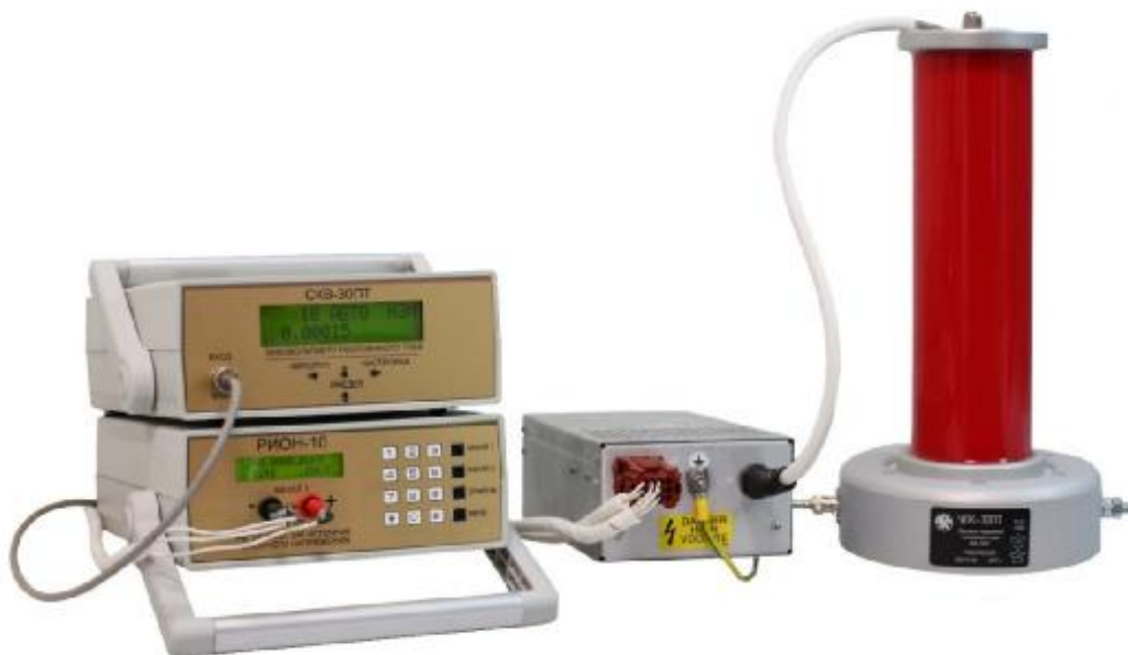
Рисунок 1 - Общий вид средства измерений

Обозначение мест пломбировки от несанкционированного доступа приведено на рисунке 2.