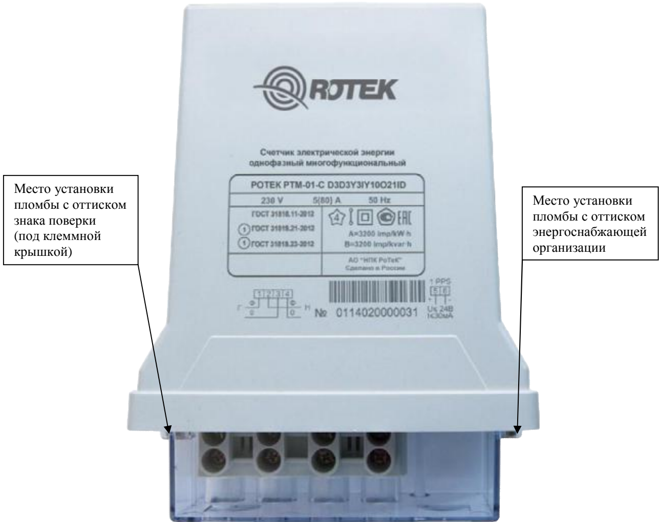
Рисунок 3 – Общий вид счетчиков и схема пломбировки от несанкционированного доступа