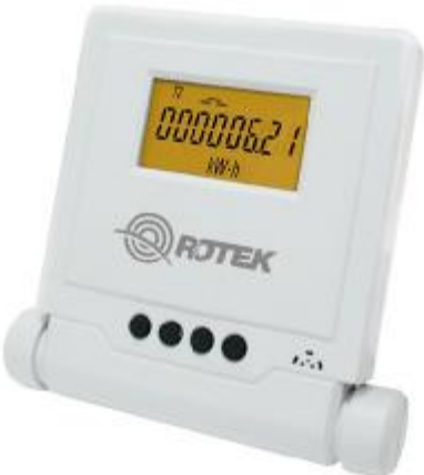
Рисунок 4 – Общий вид дистанционного индикаторного устройства