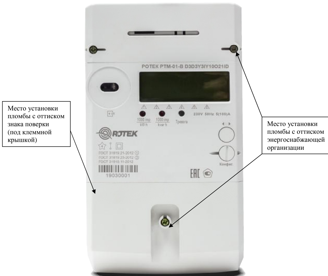
Рисунок 1 – Общий вид счетчиков и схема пломбировки от несанкционированного доступа