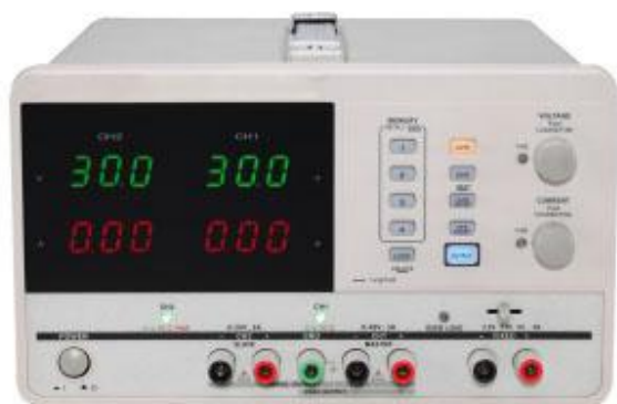
модификации ТЕКО-5401, ТЕКО-5403