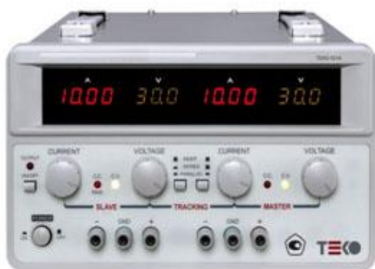
модификации ТЕКО-5214, ТЕКО-5215

Схема пломбировки источников от несанкционированного доступа представлена на рисунке 2.