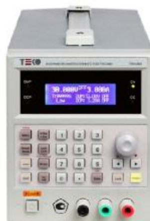
модификации ТЕКО-5502, ТЕКО-5506