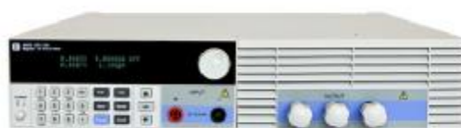
модификации ТЕКО-5605, ТЕКО-5606