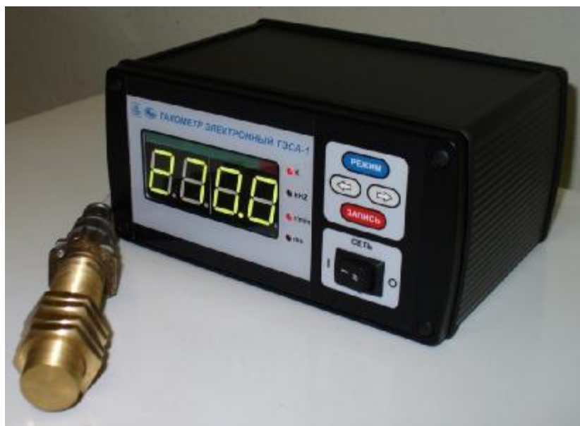
Рисунок 1 – Общий вид тахометров электронных ТЭСА-1

Для защиты от несанкционированного доступа выполнено опломбирование корпуса измерительного блока тахометра при помощи пломбировки в местах крепления передней и задней панелей. Схема пломбировки от несанкционированного доступа представлена на рисунке 2.